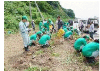
【希少植物の保護活動】

「安心・安全」をテーマに、地域の農産物を活用した農産品やオリジナル商品の開発や、トビシマカンゾウやサドオケラなどの佐渡の希少植物の増殖・植栽による環境保護活動を通じて、地域と連携し、郷土愛を育むとともに、ものづくりへの喜びや、責任感を育てています。また、模擬株式会社「STACH Island」