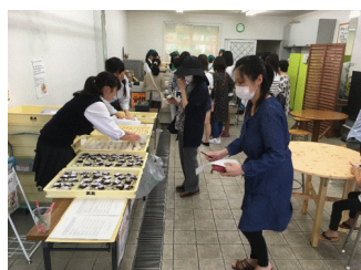
【山カフェでの販売】

「地域と連携した商品開発をとおした6次産業化の推進」をテーマに、食品科学科が中心となり地元の食品企業と連携して新商品を開発し、校外に「山カフェ」という店舗を開いて、接客・販売に取り組んでいます。今年度はこれまでの取組を発展させ、小麦アレルギーがある方も食べられるように、小麦粉の代わりに地元妙高市産の米粉を利用したアレルゲン