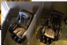
サイレントルーム