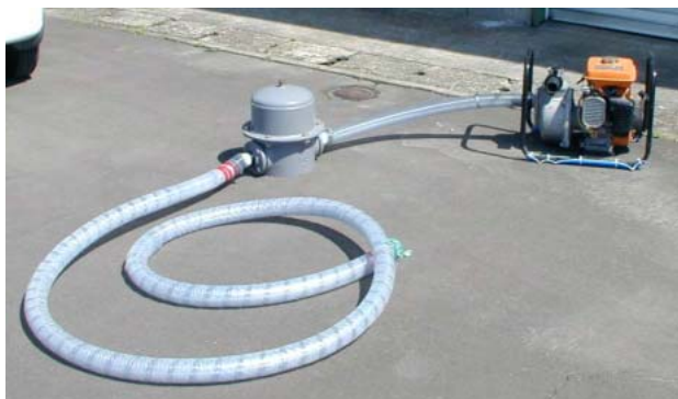
写真 駆除装置の全容

今回の実証試験において装置が最も長時間稼働した2006年6月15日の実稼働時間は、試運転を含めても30分程度で、この間に消費した燃料は1リットル未満であった。