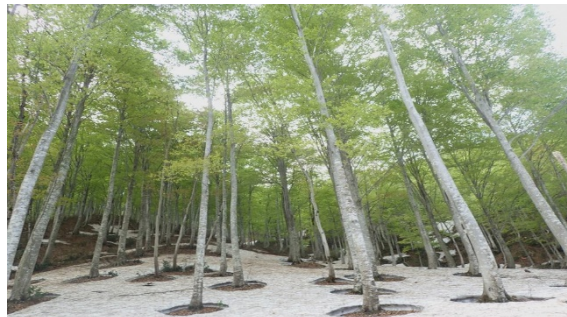
間伐による手入れがされたブナ林