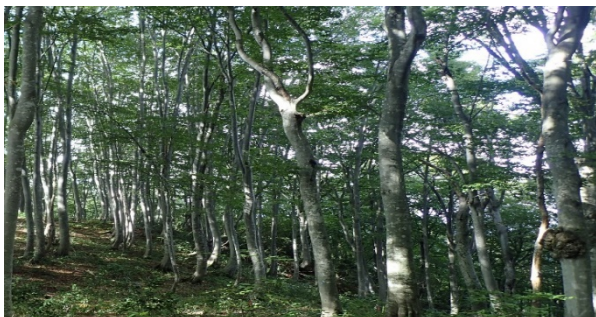
過密化したブナ林

また、野生獣被害を未然に防止するため、集落や農地に隣接する森林について、林内の見通しを阻害する低木等の刈り払いを行い、緩衝帯を整備することも必要である。