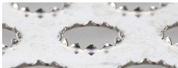
一般的なプレス機で一気に成形したもの