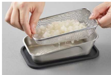
ツボエの極上おろし金 箱-hako-

令和2年、「ツボエの極上おろし金 箱-hako-」がステンレス鋼に特殊な本目立てを行っていることなどが評価され、グッドデザイン賞 2020BEST100 を受賞。