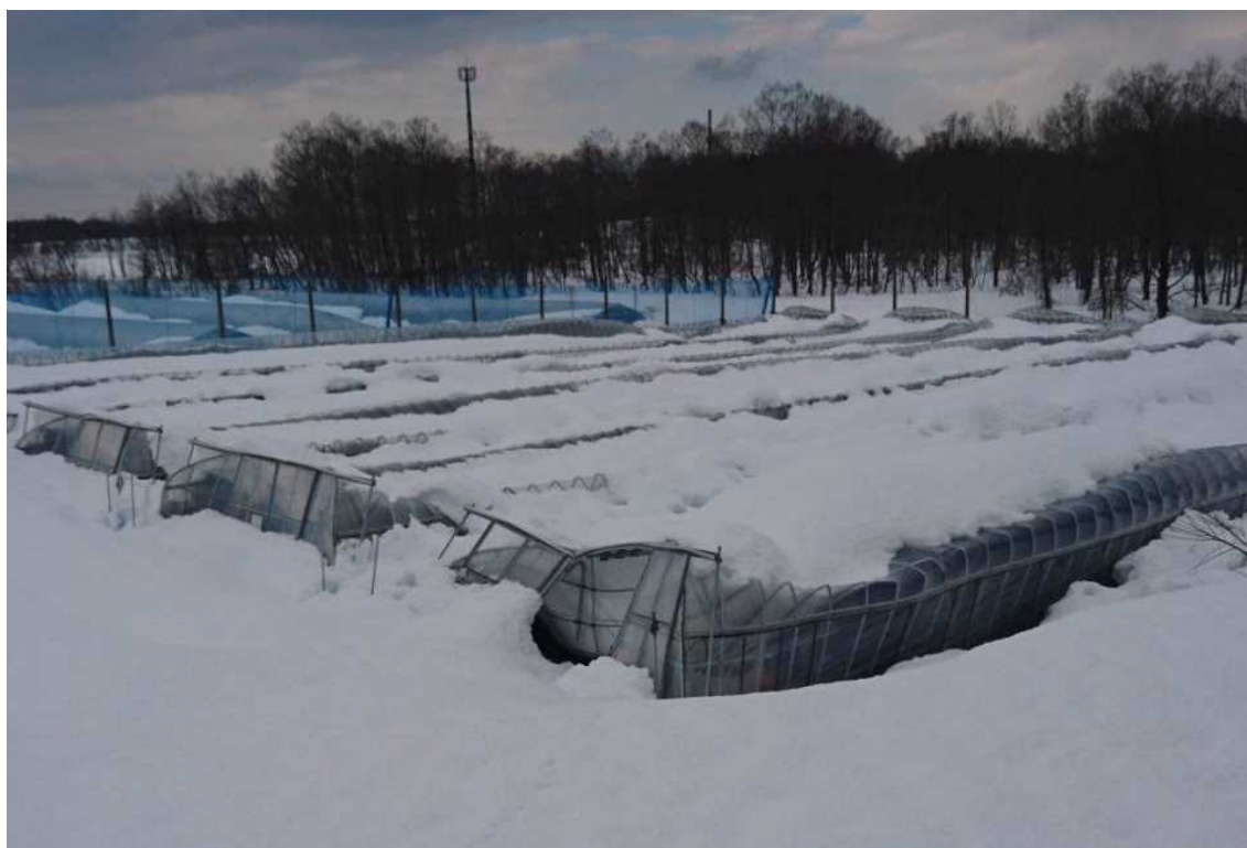
とう菜(アスパラ菜)ハウス(上越市大潟地区)(令和3年1月12日撮影)