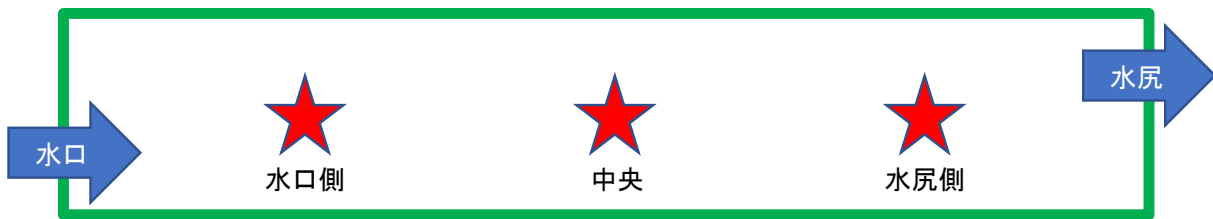
図1 雑草発生量調査地点例(星印が調査地点)