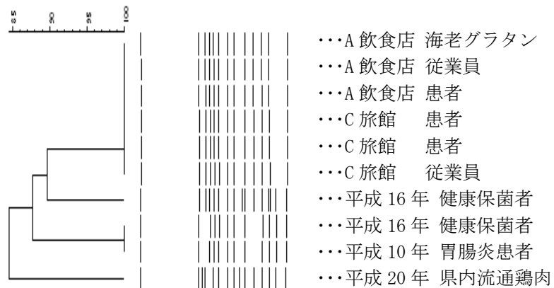
図 2 サルモネラ・インファンティスの遺伝子解析

今回の事例では、従来の細菌検査に加えて遺伝子解析を実施することにより、原因の解明に役立つ情報を提供することが出来ました。現在は、冷凍技術や輸送網の発達により食品が広域に流通しています。今後もこのような関連性のある食中毒が発生することを念頭に置き、原因究明のための科学的根拠となる検査結果を迅速に提供していきたいと考えています。