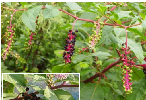
ヨウシュヤマゴボウ

ヨウシュヤマゴボウ(赤色)とイヌホオズキ(紫色)は毒性をもち、果実汁の付着した大豆は汚粒となるだけでなく農産物検査の対象外となるので、収穫作業前に必ず抜き取る。