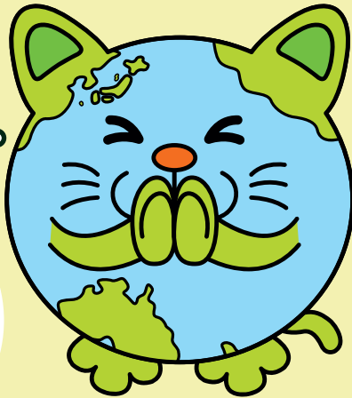
新潟県3R推進イメージキャラクター エコニャン