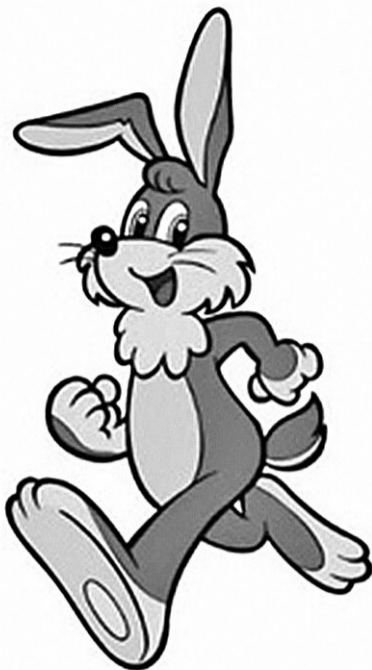
北越急行マスコットキャラクター「ホックン」

ラー版の図柄入りナンバープレートの交付を受けるには、交付手数料の他に1000円以上の寄付金が必要です。この寄付金は、上越地域の交通安全対策や観光施設・拠点等の保全や整備のために活用されます。申し込みは、専用サイト(「図柄ナンバー」)にて申し込み検査場または自動車販売店・整備工場などに相談ください。自動車販売店等に依頼する場合は、別途代行手数料がかかる場合があります。(図柄ナンバー申込サービスHP)