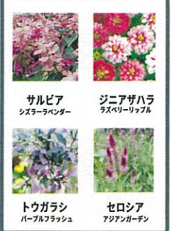
サルビアシスターランダー ジニアザハララスベリーリップル トウガラシパープルフラッシュ セロシアジアガーデン