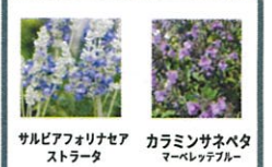
サルビアフォリナセアストラータ カラミンサネベタマーガレットブルー