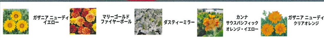
ガザニアニューディイエロー マリーゴールドファイヤーボール ダスティーミラー カンナ サウスパシフィック オレンジ・イエロー ガザニアニューディ クリアオレンジ