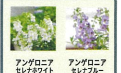
アンゲロニアセレナホワイト アンゲロニアセレナブルー