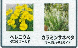
ヘレニウムダコタゴールド カラミンサネベタマーガレットホワイト