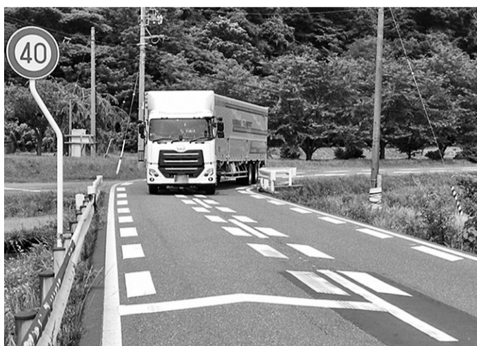
センターラインを越えてカーブを通行する大型車

必要な調査や関係者からのご理解をいただくよう作業を進め、令和4年度に工事着手し、このたび道路改良工事が完了しました。今回完了した区間は、東京発電機(株)姫川第七発電所付近の延長260mで、車道幅員が8.5m(路肩を含む)となっています。これまで車道の幅員が狭いところで6m(路肩を含む)で、くの字に折れたカーブとなっていました。大型車同士でも安心して通行できるように工事を完了させることができました。