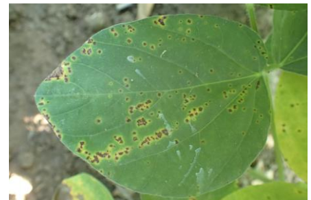
写真2 葉焼病の葉表面の病斑