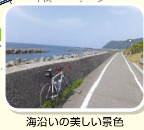
海沿いの美しい景色