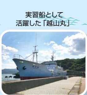
実習船として活躍した「越山丸」