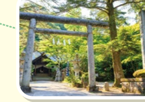
戦国時代の武将「上杉謙信」を祀った春日山神社