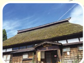
日帰り温泉でゆったり「長者温泉 ゆとり館」