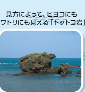
見方によって、ヒヨコにもニワトリにも見える「トットコ岩」