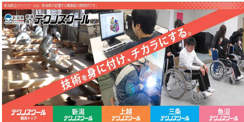
「新潟県立 テクノスクール」は、「新潟県」が設置する「職業能力開発校」で特に「ものづくり」や「地域ニーズ」に対応した分野の「職業訓練・企業支援」を実施しています。