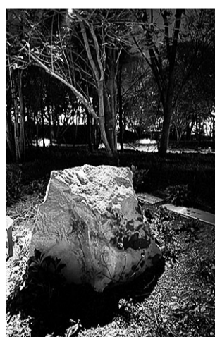
静けさの森に常設展示しているヒスイ原石