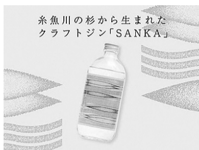
糸魚川の杉から生まれたクラフトジン「SANKA」