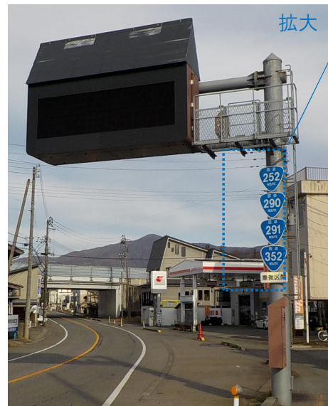
〔起点部(魚沼市中島地内)〕