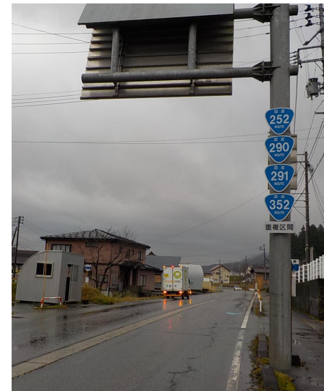
〔終点部(魚沼市並柳地内)〕