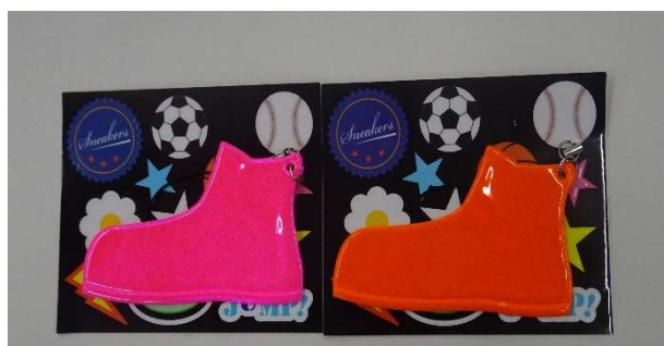
オリジナル反射材 (着せ替えスニーカー)