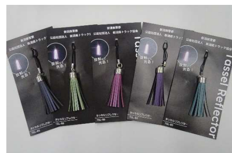
タッセル型反射材