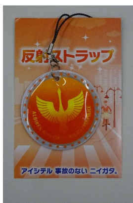
アルビレックス新潟 コラボ反射材