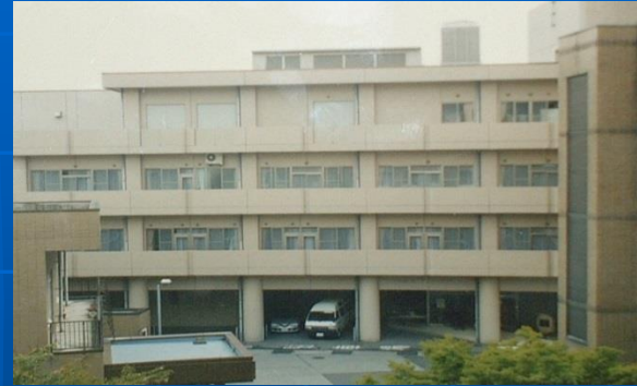
すこやか両津 90床 老健施設

介護老人保健施設：病状が安定していて入院治療が必要のない方が入所する施設。看護、機能回復等の医療ケア、介護その他の生活サービスが受けられる。