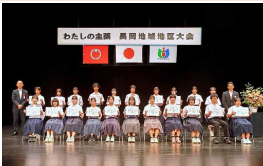
令和7年度発表者と司会者の皆さん

次代を担う中学生が日頃考えている意見を発表し、自らが健康な心身づくりに努めるとともに、地域の皆さまに青少年の健全育成に対する理解を深めていただくことを目的とし、毎年開催しています。