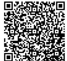
にいがたクマ出没マップ