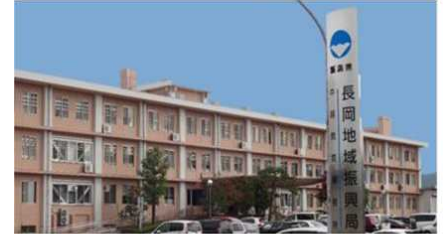
長岡地域振興局 本庁舎（環境課）