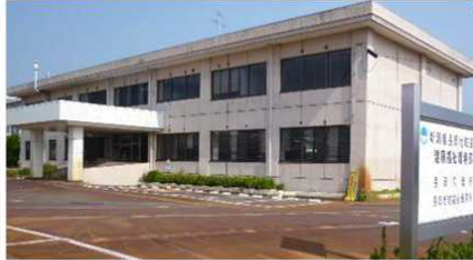
長岡地域振興局 健康福祉環境部庁舎