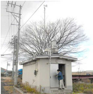
大気環境測定局（城岡局）

大気や水質等の環境モニタリングを行い情報発信するとともに、事業者等の環境負荷低減の取組や環境保全活動を推進しています。