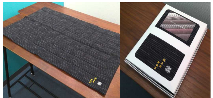
【県記念品】亀田織 ひざ掛け

長寿者を祝福し、敬老の日を中心に百歳になられる方への表敬訪問、国及び県から礼状及び記念品の贈呈を毎年行っています。令和7年度は当管内の各市町において、192人に贈呈しました。