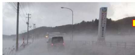
吹き止め柵設置 県道寺泊西山線 長岡市上桐地内