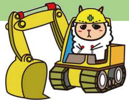
新潟県土木部マスコットキャラクター「こめゆきくん」