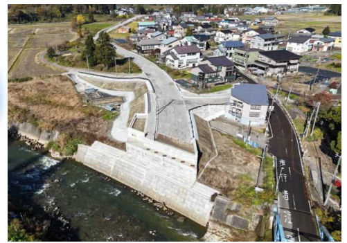
現在の状況 (R7. 11. 17撮影)