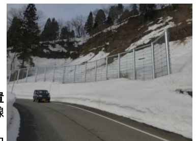
雪崩防護柵設置 県道天納川口線 長岡市 川口牛ヶ島地内