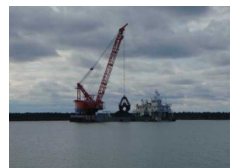
航路泊地 浚渫工事