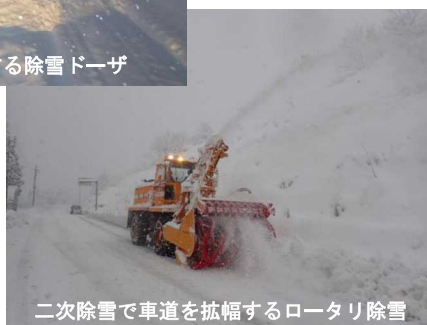
二次除雪で車道を拡幅するロータリ除雪