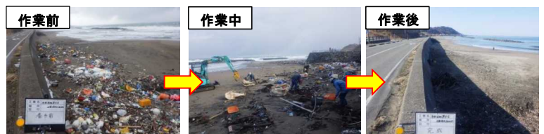
漂着物の撤去 出雲崎町久田地内

点検等により海岸の状態を把握し、漂着物を撤去するなど、海岸の維持・管理の取組を進めています。