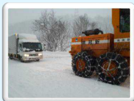
登坂不能車両が発生して除雪車両でけん引している様子 (小千谷市塩殿地内)