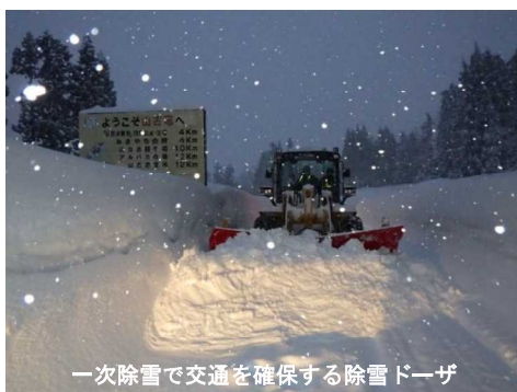
一次除雪で交通を確保する除雪ドーザ

冬期の交通を確保するため、道路除雪を行っています。また、雪崩による道路交通障害や地吹雪による視程障害を防ぐため、雪崩防護柵や吹き止め柵を設置し、安全な冬期の道路交通を確保しています。