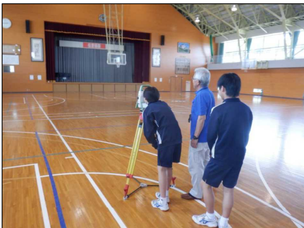
土木出張PR (小千谷市立片貝中学校)