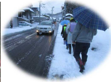
冬期の通学の状況 (地域の見守り隊が 同行して安全確保)