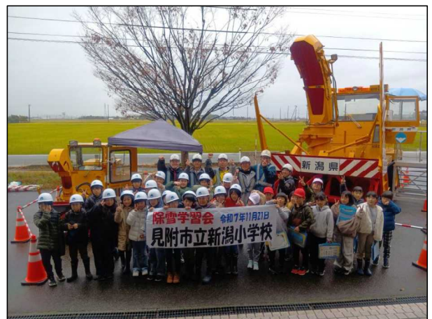
除雪学習会 (見附市立新潟小学校)