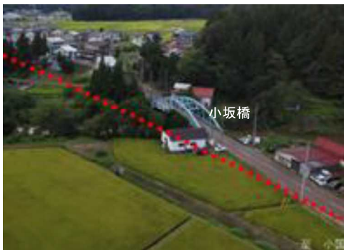
小国側から長岡方面を望む

本事業により通過交通を集落内からバイパスへ振り替えることで、自動車及び歩行者の安全性の向上が図られます。あわせて老朽化した小坂橋の架け替えも行います。