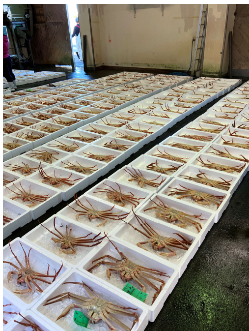
図1 市場に並べられたズワイガニ

新潟県と新潟越後広域水産業再生委員会は、たくさん水揚げされるズワイガニの中でも厳しい基準をクリアした高品質なものを「越後本ズワイ」としてブランド化しています。その数はおよそ100匹に1匹とも言われ、身がぎっしりと詰まった良質なカニと謳われています。糸魚川市内の飲食店内にもポスターが張られており、越後本ズワイを身近に感じるとともに、その知名度が年々向上していることを実感しました（図2）。機会があれば、皆さんも是非ご賞味ください。