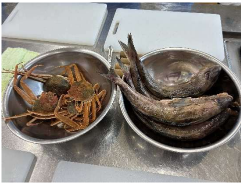
材料のメガニとホッケ

11月11日、村上市立岩船中学において地元の魚を使った調理実習が行われました。これは毎年この時期に新潟漁協岩船港支所の協力のもと漁師のお家の方を講師に招いて行われている授業です。例年、村上市特産の「鮭」を使ってフライやつみれ汁を作っていましたが、今年は、鮭の記録的な不漁に見舞われ、実習で使う数尾の鮭でさえ確保が困難な状況です。そのため、鮭の代わりに岩船港産のホッケとメガニ（ズワイガニの雌）を使って、ホッケフライとメガニ汁の実習となりました。ホッケは鱗取りと三枚おろしから始めます。ほとんどの生徒が未経験で、かなり苦戦しているようでした。一方、メガニ汁の調理は簡単でカニを洗ったあと、そのまま茹でて味噌と刻みネギを入れれば完成です。お昼は、自分達で作った「ホッケフライ、サラダ、メガニ汁」と豪華なメニューとなりました。脂がのって柔らかいサクサクのホッケフライと、1尾丸ごと入ったメガニ汁に「美味しい！」という声が沢山聞かれました。調理実習をとおして地元で獲れる魚の美味しさと調理法を学ぶ貴重な機会となったと思います。