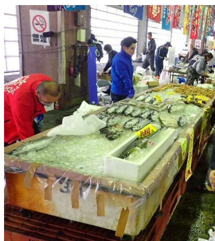
漁業士会（鮮魚）ブース