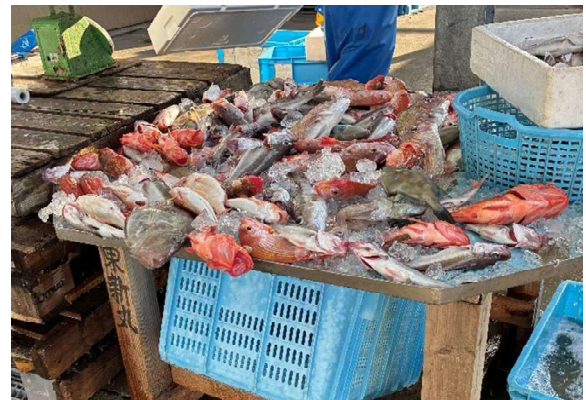
この日の漁獲（タイなど）