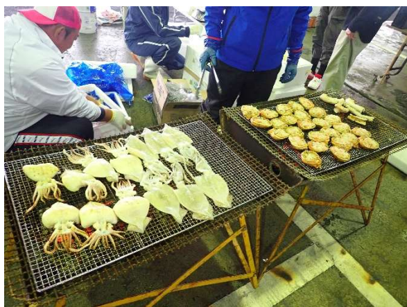
漁業士会販売（屋台）ブース

このようなイベントの開催により、佐渡産水産物の知名度向上や消費拡大につながることを期待しております。