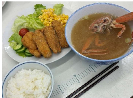
完成品（ホッケフライ、サラダ、メガニ汁、ご飯）