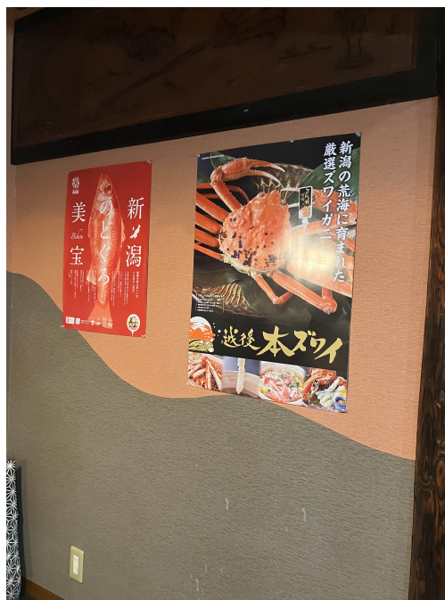
図2 飲食店に飾られた越後本ズワイのポスター