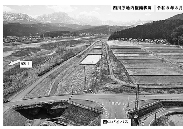
西川原地内整備状況 (長野県側を望む)

（けいはん）や用水、農道の付け替えを経て、現在は主に本体の工事を行っています。現道を拡幅する工事は、終日の片側交互通行規制を実施しながら工事を行うこともありますが、安全に工事を進めることを心掛けています。 ■本記事への問い合わせ先 糸魚川地域振興局地域整備部道路課 電話 025・553・1975