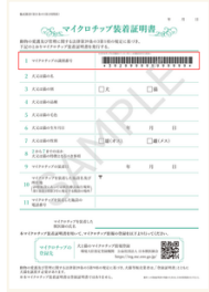
(マイクロチップ装着証明書)

iPhone (iOS 12以上) で撮影する場合 iPhoneで撮影すると、ファイルの拡張子が「.HEIC」になっていることがあります。以下の操作をし、ファイルの拡張子を変更してから撮影を行ってください。 ①設定アプリを起動する。 ②[カメラ]→[フォーマット]の順にタップする。 ③「互換性優先」を選択する。