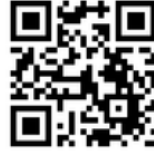
マイクロチップ登録サイトはこちら