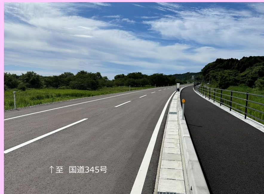
完成区間（暫定供用区間）