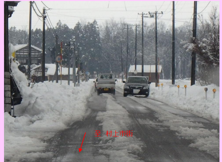
積雪時すれ違い状況