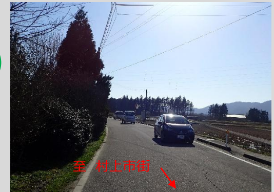
村上方面から鶴岡方面の現道