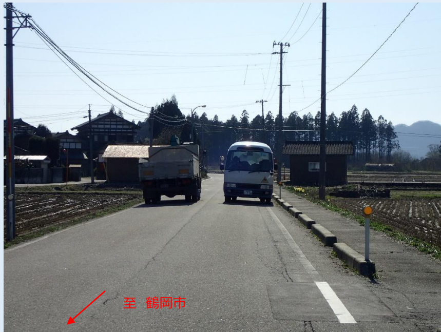
大型車すれ違い状況