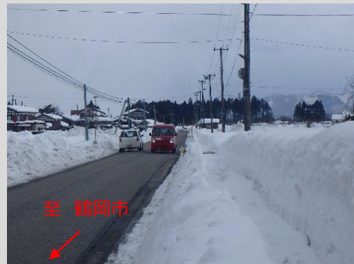
鶴岡方面から村上方面の現道