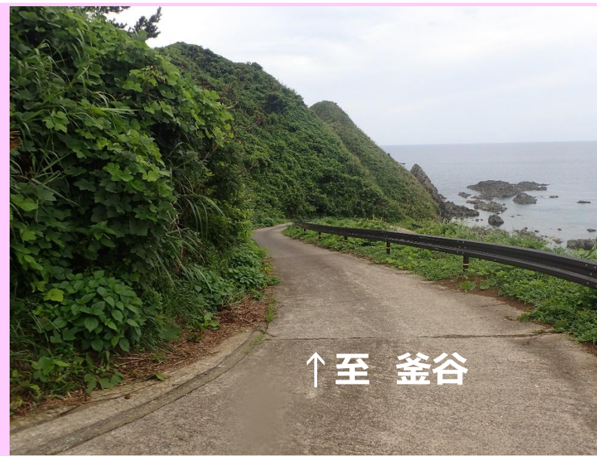
通行の支障となるヘアピンカーブ