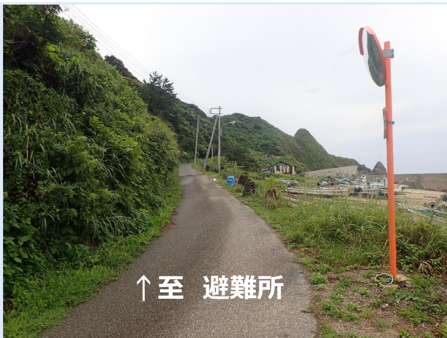
釜谷集落から避難所に向かう現道