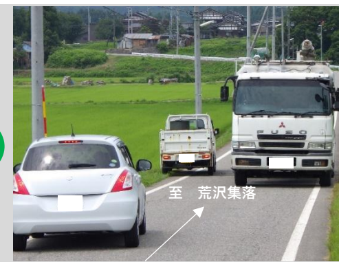
すれ違いも困難な現道