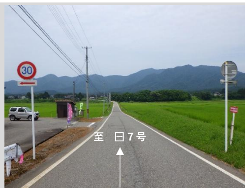
小須戸地内の現道