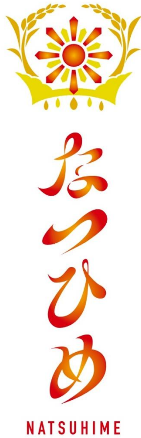
カラー表示(縦組み)