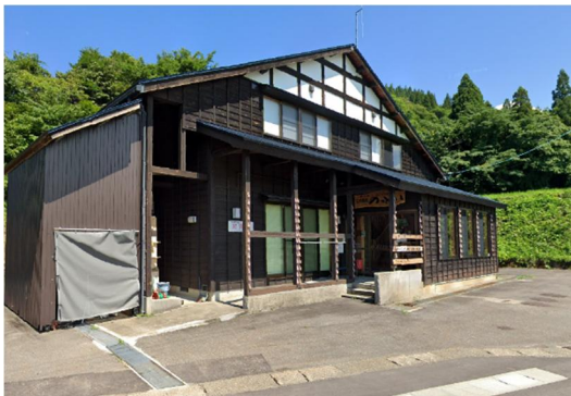
交流施設「のっとこい」

例年11月第1日曜日に枯木又地区では、交流施設「のっとこい」で収穫祭を行ってありますが、今年から棚田サポーターの第3回目の活動として実施することになりました。多くの方からのご参加お待ちしております！