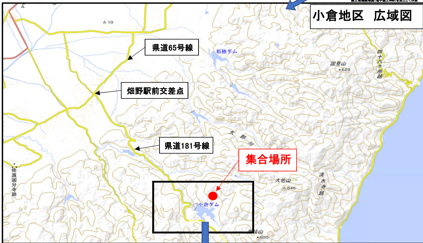
国土地理院地図(電子国土Web)を加工して作成