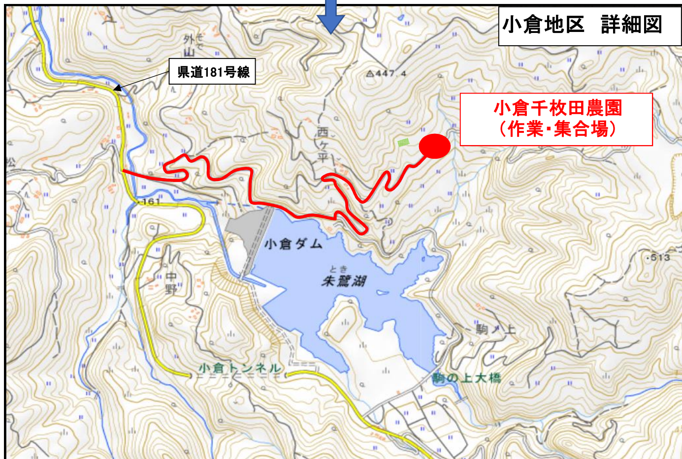
国土地理院地図(電子国土Web)を加工して作成