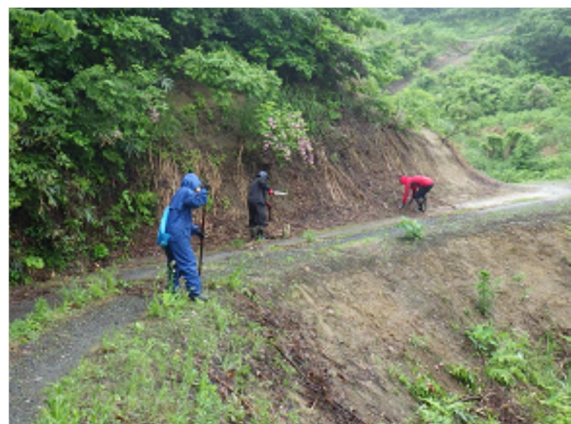
昨年度の活動の様子