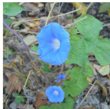
アメリカアサガオ