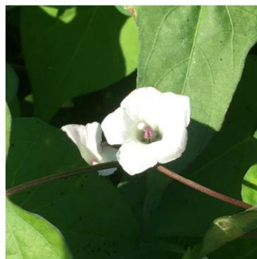
マメアサガオ 写真 帰化アサガオ類