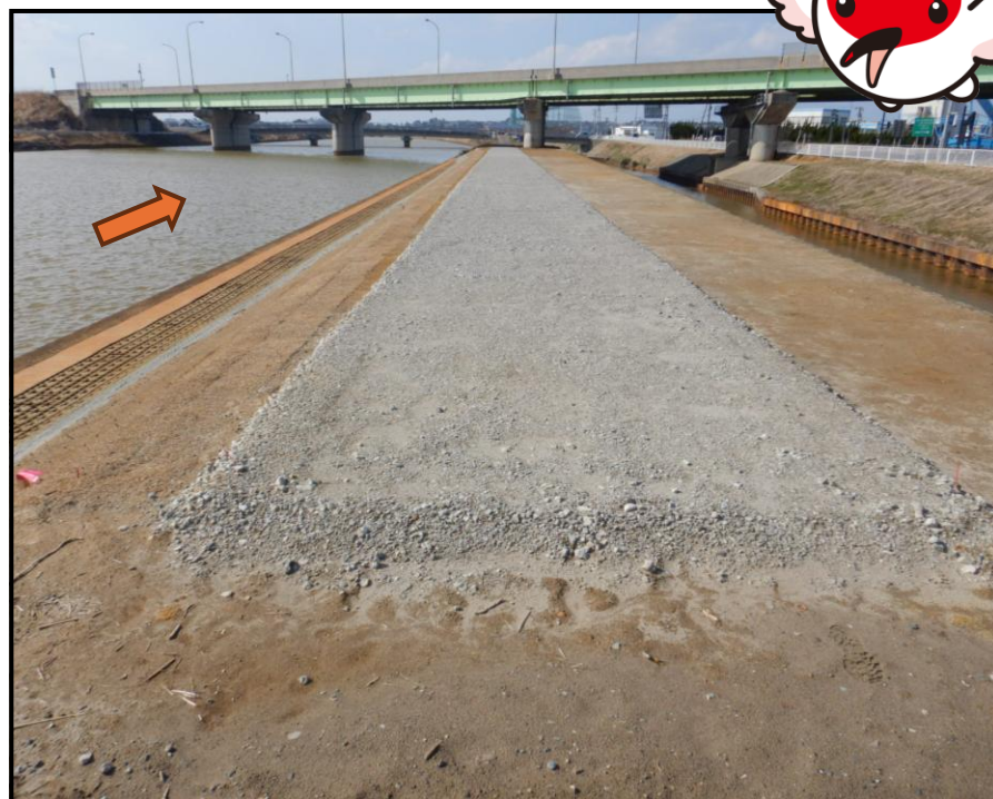
令和8年3月16日時点の復旧状況（終点から起点を望む）