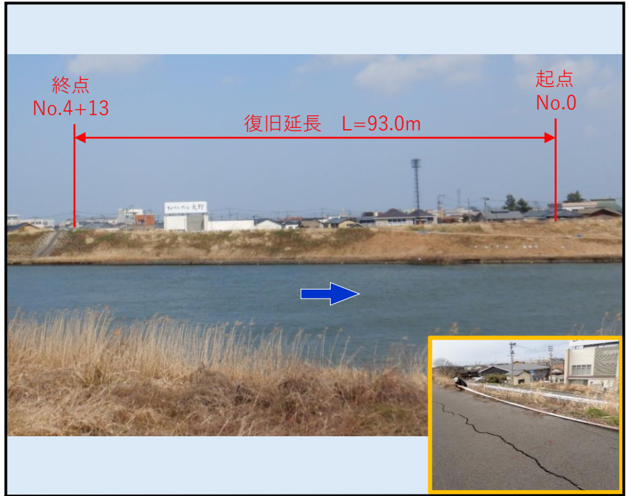
令和6年3月15日 対岸から全景を望む