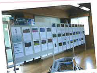
2F: 魚沼市八十八景パネル展示 魚沼市各地のおまつりや暮らし、四季折々の景色など様々な写真が展示されているコーナーです!