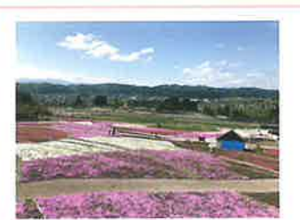
①展望テッキポイント 広場の上にそびえたつ展望台です。ここに来れば広場の芝桜一帯が見渡せます!