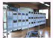
石川雲蝶パネル展示