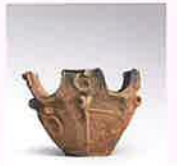
文化財パネル展示