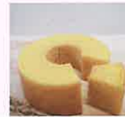
米粉スイーツ販売