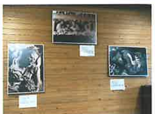
2F: 石川雲蝶パネル展示 日本のミケランジェロこと石川雲蝶が作り上げた木製彫刻の写真が展示されています!