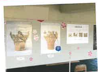
1F: 文化財パネル展示 魚沼市で出土した縄文土器のパネル展示コーナーです。魚沼の歴史や縄文時代に興味がある方はぜひ!