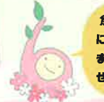
しばざくらん 花と緑と雪の里 イメージキャラクター

魚沼芝桜まつりではInstagramにてフォトコンテストを開催しております! 素敵な写真をいっぱい撮って、ぜひ応募してみてください!