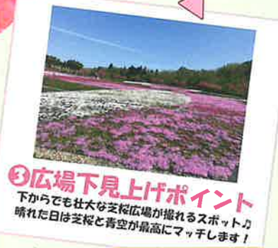
③広場下見上げポイント 下からでも壮大な芝桜広場が揺れるスポット。晴れた日は芝桜と青空が最高にマッチします!

魚沼芝桜まつりではInstagramにてフォトコンテストを開催しております! 素敵な写真をいっぱい撮って、ぜひ応募してみてください!