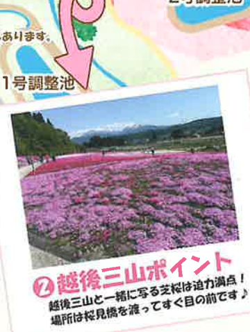
②越後三山ポイント 越後三山と一緒に写る芝桜は迫力満点! 場所は桜見橋を渡ってすぐ目の前です!