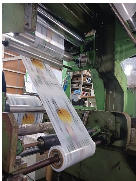
フィルムへの印刷と巻取り

▶ プラスチック包装における環境配慮材料の活用や薄肉化等を通じて、プラスチックの3Rに取り組んでいる。