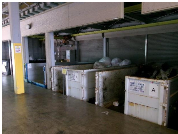
廃プラスチックの分別場所

▶ 部門横断組織を先導役とした社内の取組に加え、廃棄物処理業者への働きかけや連携により、3Rを推進している。