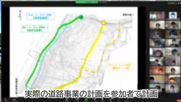
実際の道路事業の計画を参加者で計画