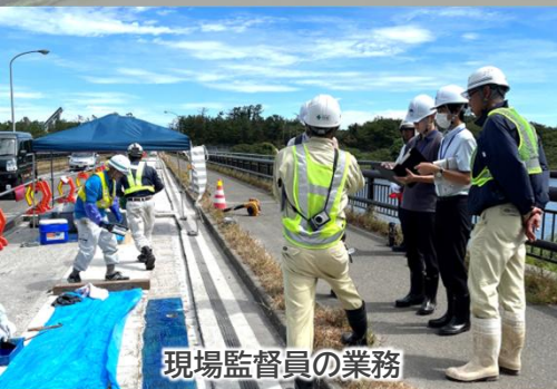
現場監督員の業務