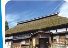
日帰り温泉でゆったり「長者温泉 ゆとり館」