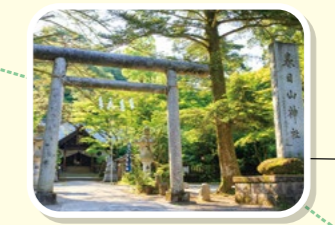
戦国時代の武将「上杉謙信」を祀った春日山神社