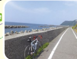
海沿いの美しい景色