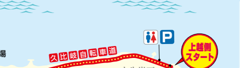
上越市立水産博物館「うみがたり」