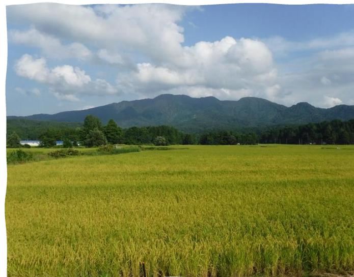
写真：谷根のハナモモ、女谷の田園風景