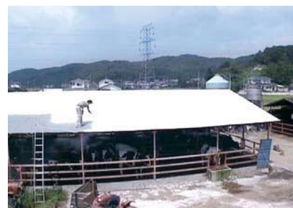
屋根への石灰塗布