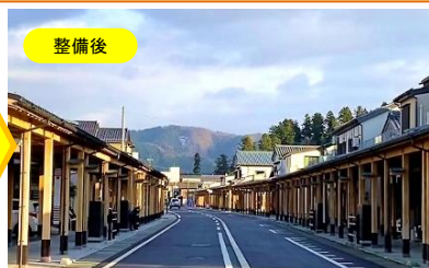
拡幅に併せて無電柱化し良好な景観に