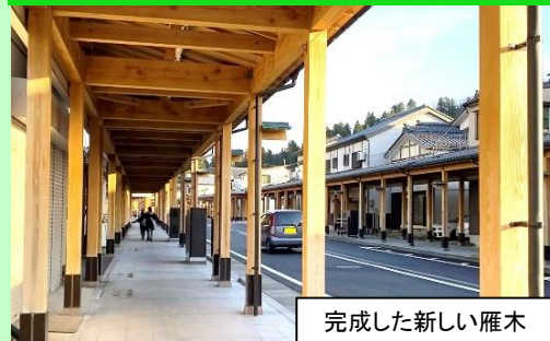
完成した新しい雁木