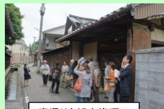
裏通りも観光資源に