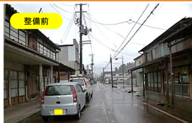
狭く、電柱が立ち並ぶ現道