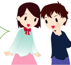
参加者の声（アンケートより）