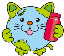
新潟県3R推進キャラクター 「エコニャン」

新潟県では、「資源を大切に作る循環型の地域社会」の実現に向け、学校や地域での環境教育・環境学習を進めています。