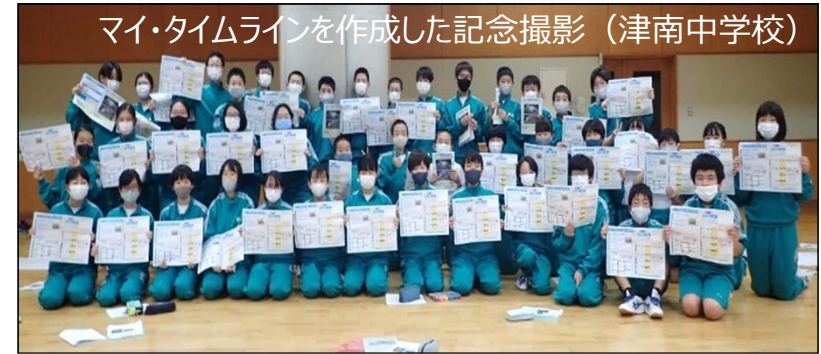
マイ・タイムラインを作成した記念撮影（津南中学校）

近年の想定を上回る洪水・土砂災害から、主体的な避難行動により人命を守るため、 小学生高学年・中学生・高校生を対象とした水防災教育を支援。