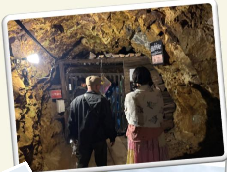
洞窟はドラマティック！ 鉱山で働いていた人の 様子がよくわかった