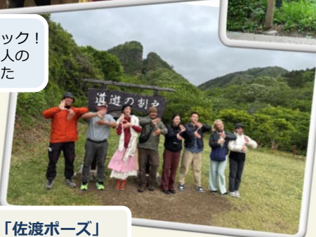
みんなで「佐渡ポーズ」