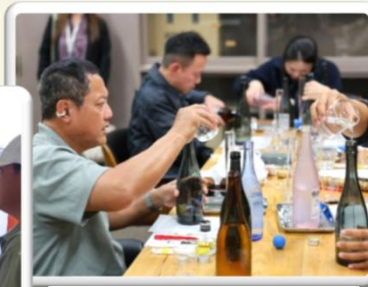
日本酒ブレンド 挑戦中