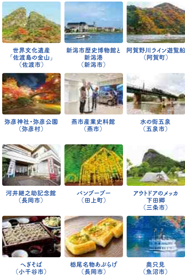
世界文化遺産「佐渡島の金山」(佐渡市) 新潟市歴史博物館と新潟港(新潟市) 阿賀野川ライン遊覧船(阿賀町) 弥彦神社・弥彦公園(弥彦村) 燕市産業史料館(燕市) 水の街五泉(五泉市) 河井継之助記念館(長岡市) バンブーブー(田上町) アウトドアのメッカ 下田郷(三条市) へぎそば(小千谷市) 栃尾名物あぶらげ(長岡市) 奥只見(魚沼市)