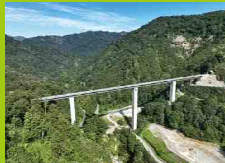
八十里越天空大橋