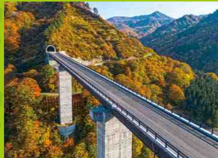
八十里越天空大橋