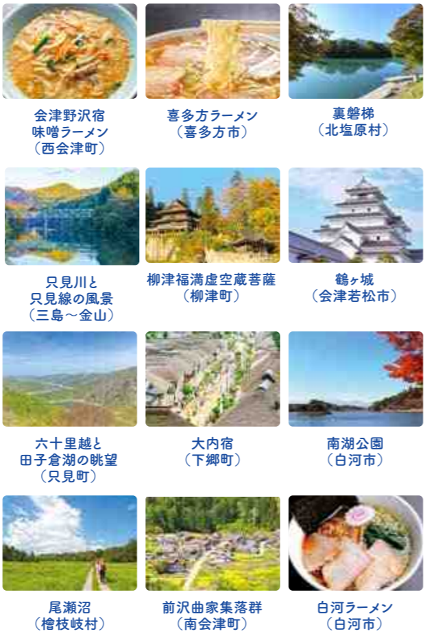
会津野沢宿味噌ラーメン(西会津町) 喜多方ラーメン(喜多方市) 裏磐梯(北塩原村) 只見川と只見線の風景(三島～金山) 柳津福満虚空蔵菩薩(柳津町) 鶴ヶ城(会津若松市) 六十里越と田子倉湖の眺望(只見町) 大内宿(下郷町) 南湖公園(白河市) 尾瀬沼(檜枝岐村) 前沢曲家集落群(南会津町) 白河ラーメン(白河市)