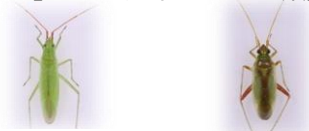
アカヒゲホソミドリ アカスジカスミカメ カスミカメ