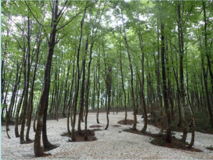
薪炭ブナ林(間伐前)