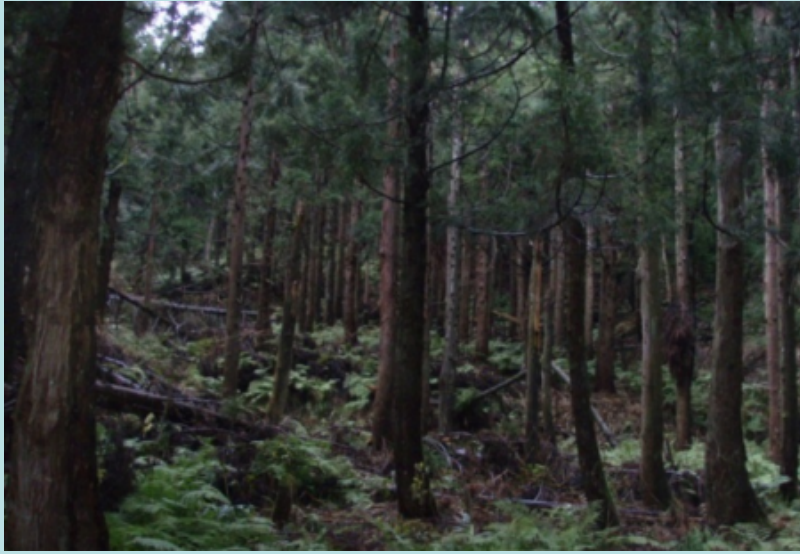
手入れ不足の森林