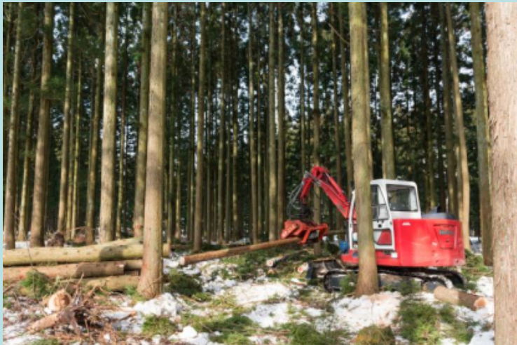
経済林(間伐の実施状況)